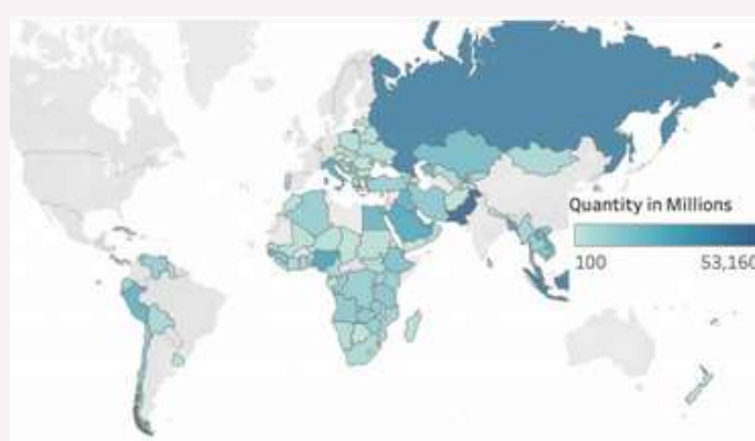
Figura 3. Inversió total de la BRI per països i capital