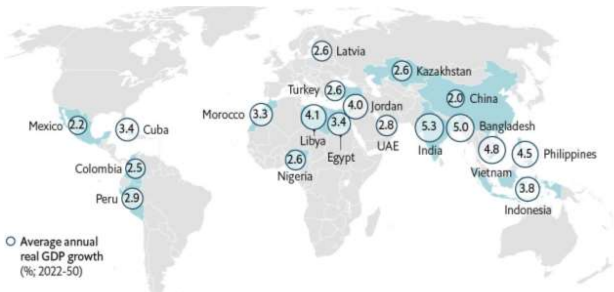
Figura 2. Principals països per creixement anual del PIB (% , 2022-2050)

Tot i que Europa ha estat la protagonista de la geopolítica mundial el 2022, no hi ha un retorn del centre de gravetat geopolític cap a l'Atlàntic. El centre continua a l'Indo-Pacífic, on les tensions entre els Estats Units i la Xina en la lluita pel domini de la regió amb el major potencial d'expansió econòmica s'han accentuat encara més en el darrer any 5 . Com s'observa en la figura 2, bona part dels països que més creixeran fins al 2050 es troben a la regió de l'Indo-Pacífic, encapçalats per l'Índia, Bangladesh, el Vietnam, les Filipines i Indonèsia.