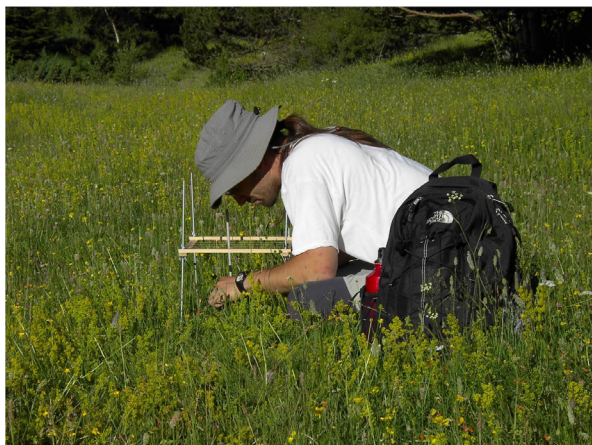
La consultoria ambiental requereix trepitjar el terreny

A més a més, segons Rosell, "ara seguim el procés d'optimització de la gestió de tots els processos, per aconseguir donar serveis de la màxima qualitat amb la mínima inversió de recursos",